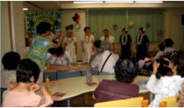
あおぞらイベント ハワイアンのつどい

さらに、憩いとやすらぎ・地域交流の場としての役割をになう、喫茶・軽食事業「喫茶あおぞら」を営業しております。