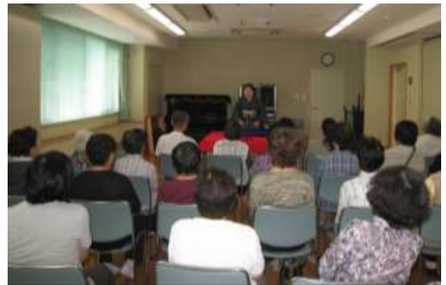
笑う門には福来る 落語（生出演）