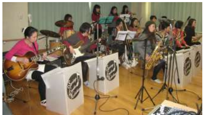
ジャズコンサート スイングレディス国分寺