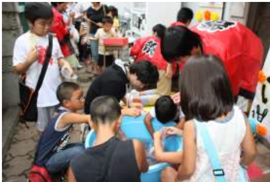
さわやか夏まつり スーパーボールすくい